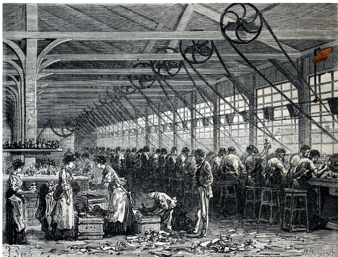
Sans, la CGT, on en serait encore là !! Rejoignez-nous !

Si vous êtes victimes ou témoin, n'attendez pas : faites un signalement sur la plateforme régionale ( ecoute.signalement@nouvelle-aquitaine.fr ), remplissez, si c'est possible, le registre de santé et de sécurité au travail (SST) et contactez un syndicat en même temps.