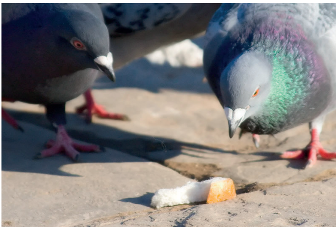
On nous dit que cette fois, c'est vraiment vrai. Des miettes, il n'y en a plus beaucoup.

38 000 € par an de surcoût par rapport aux prévisions de prise en charge, c'est ce que l'administration a refusé lors du CST du 14 novembre.